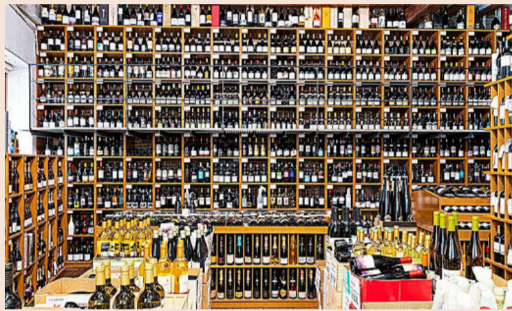
Vila Viniteca ofrece 10.000 referencias en un antiguo colmado de 1932 de Barcelona.