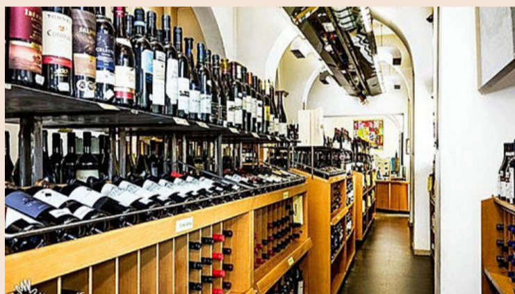
Trimani, en Roma, cuenta con más de 5.500 referencias de todo el mundo.