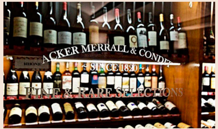
Acker Wines acaba de celebrar su 200 aniversario en Nueva York.