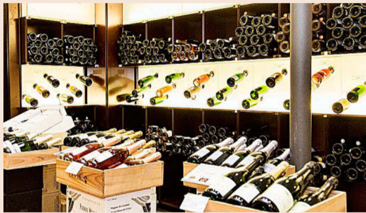
Lavinia celebra este año su 20 aniversario. En la imagen, su tienda en Madrid.